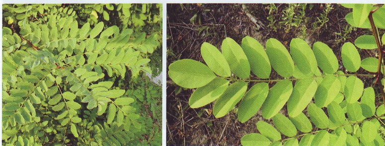
Obr. 2: Detail listu agáta bieleho