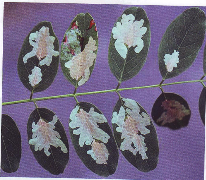
Obr. 5: Psočka agátová ( Parectopa robiniiella Clemens)