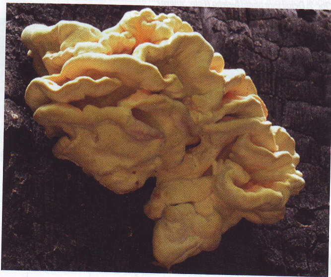
Obr. 6: Síravec obyčajný ( Laetiporus sulphureus )

cesy, ktorými porasty agátu ovplyvňujú svoje okolie, môžeme uviesť aj obohacovanie pôdy dusíkom, ktoré je spôsobené baktériami žijúcimi v koreňových hľuzách (rod Rhizobium sp.). Z toho vyplývajú nasledovné zmeny druhového zloženia bylinnej etáže, rozširovanie burín a nitrofilnej vegetácie. K zmenám na lokalitách s výskytom agátu dochádza aj v dôsledku alelopatického účinku agátu na rastliny vo svojom okolí. V susedstve agátu sa nedarí rásť prirodzene u nás rastúcim drevinám, až na výnimku bazy čiernej, s ktorou tvorí nepreniknuteľné porasty. Rastlina obsahuje látky robinetín, myricetín a quercetín. Ostatné dreveny v pôdach pozmenených agátom neprosievajú. Rastlina je okrem kvetov celá jedovatá, najmä však kôra. Listy obsahujú vysoké množstvo trieslovín, preto sa opad dlhodobo rozkladá a neumožňuje tvorbu humusu. Navyše z listového opadu sa do pôdy uvoľňujú fenolkarboxylové kyseliny, ktoré inhibujú klíčenie ostatných rastlín, vrátane drevín a vznikajú monokultúry agáta. Alelopatiou v oblasti škôlkárstva a obnovy lesa sa zaoberal napríklad prof. Čaboun, ktorý pozorovaním rastu semenáčikov rôznych druhov drevín zistil, že semenáčky agátu mali silný negatívny vplyv na semenáčky borovice sosny, pričom ovplyvňovanie bolo len v dôsledku prchavých látok, pri pestovaní v úplne oddelených nádobách. Autor zhodnotil, že inhibičný vplyv látok nadzemnej časti agátu na semenáčky borovice bol taký veľký, že v okruhu 15 cm od agátu nerástol ani jeden semenáčik borovice.