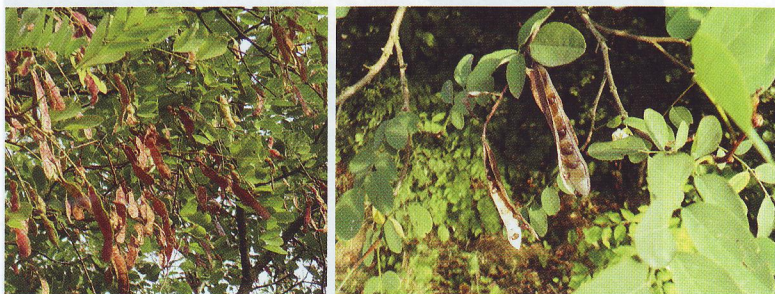
Obr. 3: Detail plodov agáta bieleho

nia s celou škálou rôznych podmienok prostredia, a tiež sa vyznačuje vysokou plodivosťou a semenami, ktoré sa ľahko rozširujú. Agát začína plodiť už v 5. až 7. roku a produkuje ročne množstvo semien, ktoré