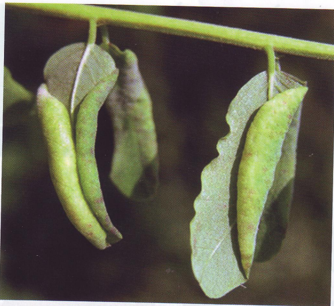
Obr. 4: Bylomor agátový ( Obolodiplosis robiniae Haldemann)